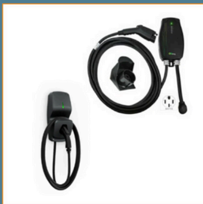
Exemple de borne de recharge