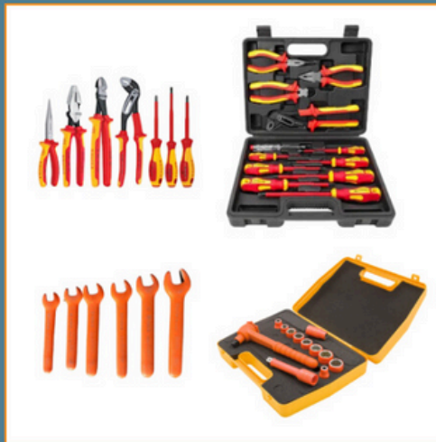
Exemple d'outillage isolé haute tension

Si vous n'êtes pas propriétaire de certains des équipements, veuillez cocher équipement en location et indiquez la personne responsable à contacter.