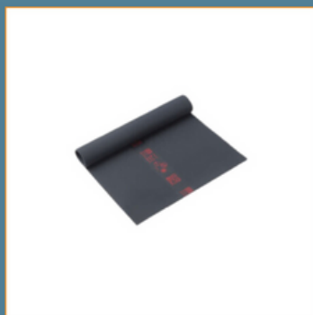
Exemple du matériel de sécurité