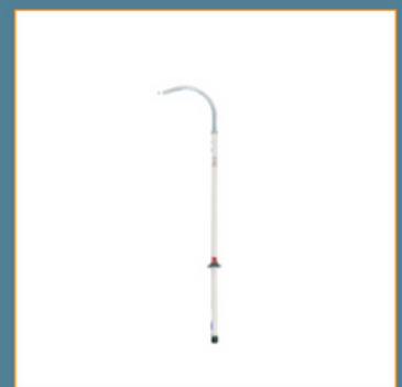
Exemple du matériel de sécurité