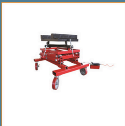
Exemple de table de levage et dépose batterie haute tension

Bien indiquer le nom de la compagnie de location , le nom de la personne contact et un numéro de téléphone