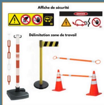
Exemple du matériel de sécurité