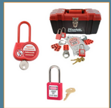
Exemple du matériel de sécurité