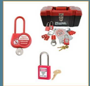
Exemple du matériel de sécurité