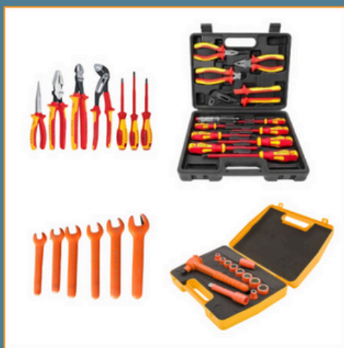
Exemple d'outillage isolé haute tension

Si vous n'êtes pas propriétaire de certains des équipements, veuillez cocher équipement en location et indiquez la personne responsable à contacter.